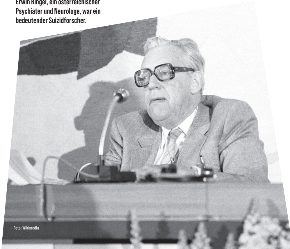
Erwin Ringel, ein österreichischer Psychiater und Neurologe, war ein bedeutender Suizidforscher.

Auf der anderen Seite gibt es eine Reihe von Warnsignalen, die auf eine suizidale Gefährdung hinweisen können: häufiges Sprechen über Tod und Sinnlosigkeit, Rückzug aus sozialen Kontakten, unerwartete Veränderungen in Verhalten und in den Gefühlsäusserungen, zunehmend riskantes Verhalten im Sinne des «Aufs-Spiel-Setzens». Im Allgemeinen nehmen die Modelle der Suizidprävention (auf die wir hier nicht im Einzelnen eingehen können) diese Risikofaktoren auf, indem sie versuchen, die Schutzfaktoren zu stärken: soziale Unterstützung in Familie und Gruppen, psychotherapeutische und psychiatri-