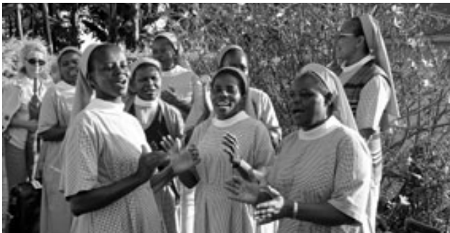
Herzlicher Empfang in Maua