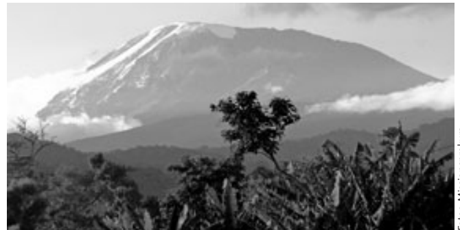
Der höchste Berg Afrikas, der Kilimanjaro